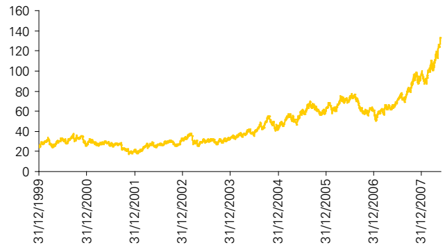
WTI Light Sweet Oil Future

De onderliggende waarde van de Commerzbank olie notes is de WTI ('West Texas Intermediate') Light Sweet Oil future welke verhandeld wordt op de NYMEX (New York Mercantile Exchange).