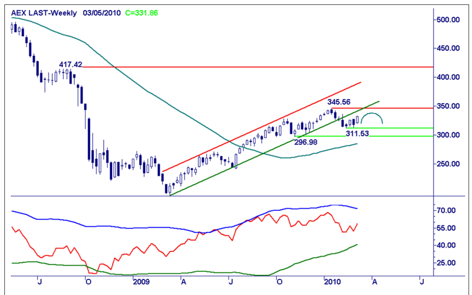
Weekgrafiek AEX Index. Bron: BTAC Visuele Analyse , 4 maart 2010

Kortstondige oplevingen gebruiken om verdere portefeuillebescherming in te bouwen.