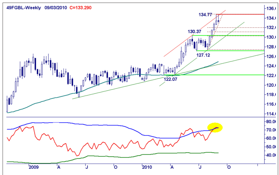
Weekgrafiek Bund Future.

Winsten verzilveren, kruit droog houden en wachten op een nieuwe hogere bodem.