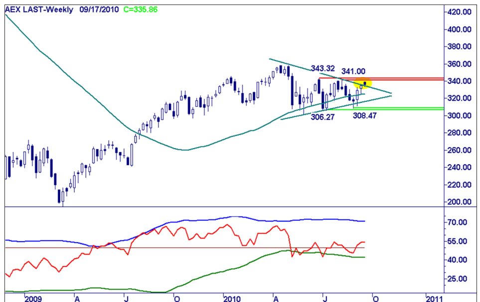
Weekgrafiek AEX Index.

Het blijft moeizaam gaan, enige terughoudendheid is op zijn plaats.