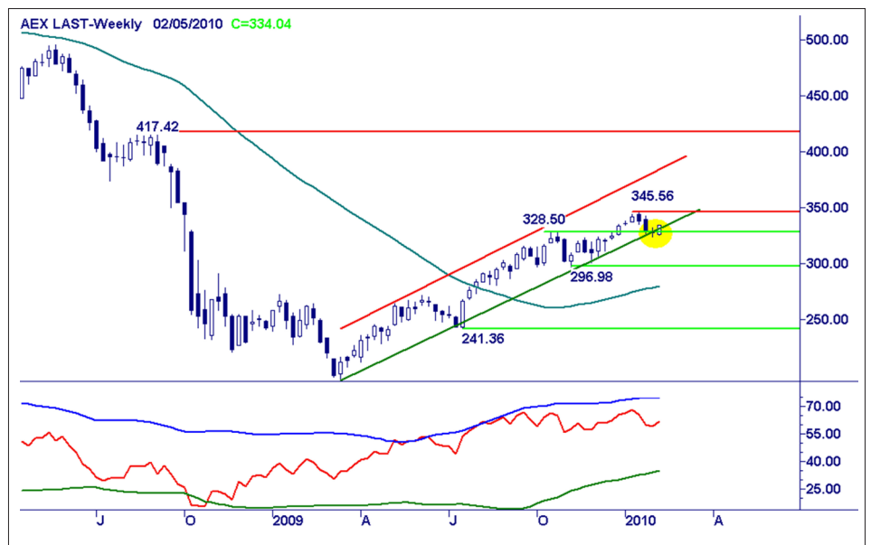
Weekgrafiek AEX Index.

De koopconditie is nog valide, maar dan moet de markt deze week een stevige witte candle plaatsen en boven de steunlijn sluiten. De stieren zijn goed op weg, volg hen met kleine posities.