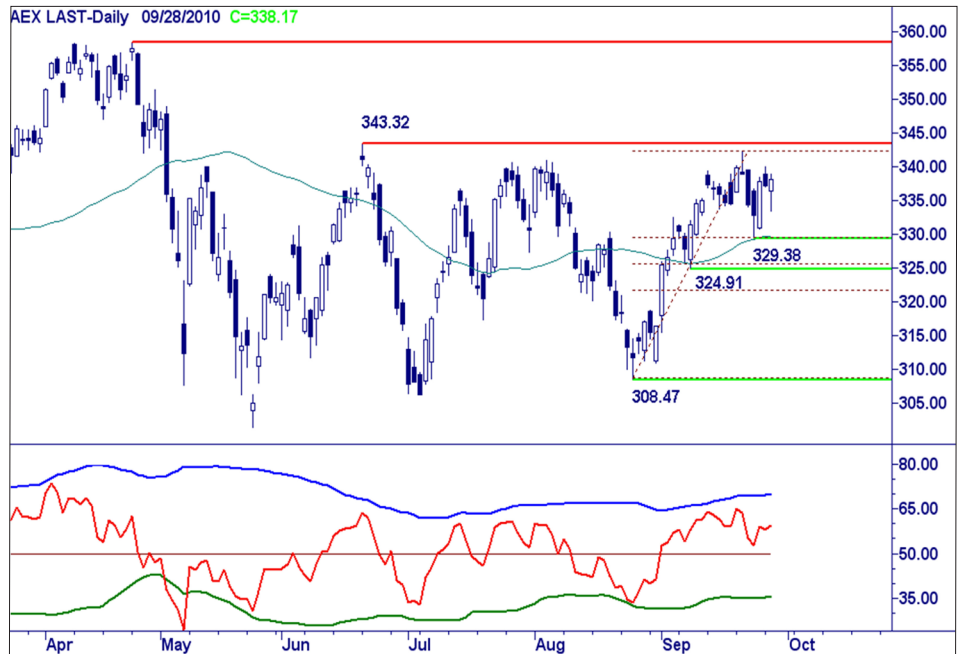
Daggrafiek AEX index.

Koopjesjagers en speculanten houden stand. Defensieve beleggers wachten op een uitbraak boven 343,30. Onder 329 is iedereen weg.