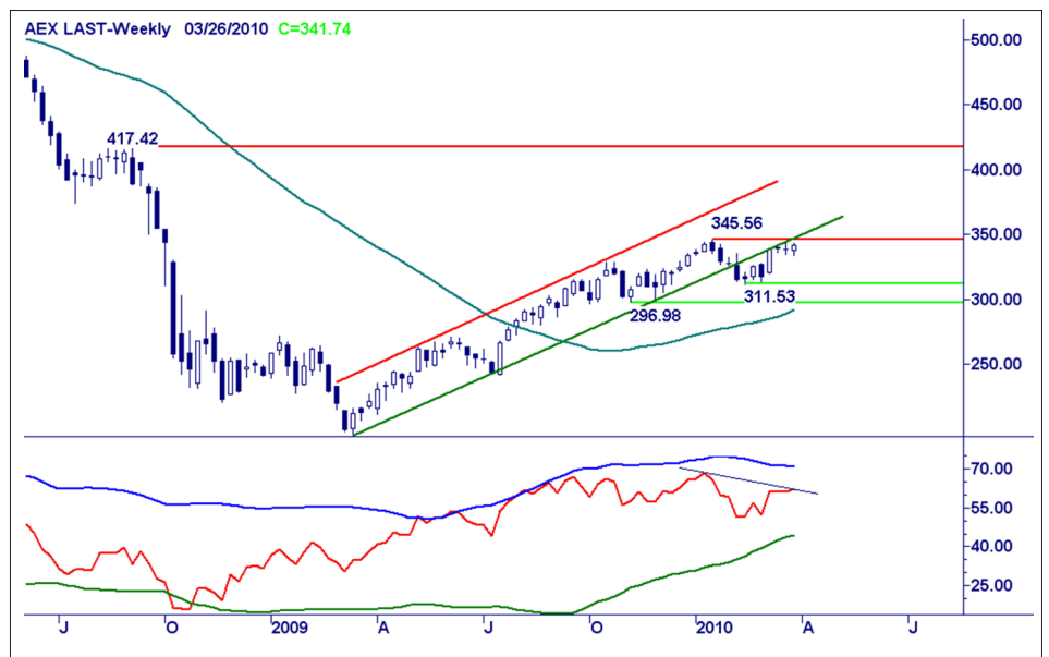
Weekgrafiek AEX Index. Bron: BTAC Visuele Analyse , 25 maart 2010

Het 345 kantelpunt is zeer nabij. Laat de markt maar aangeven wat zij wil doen met deze cruciale grens.