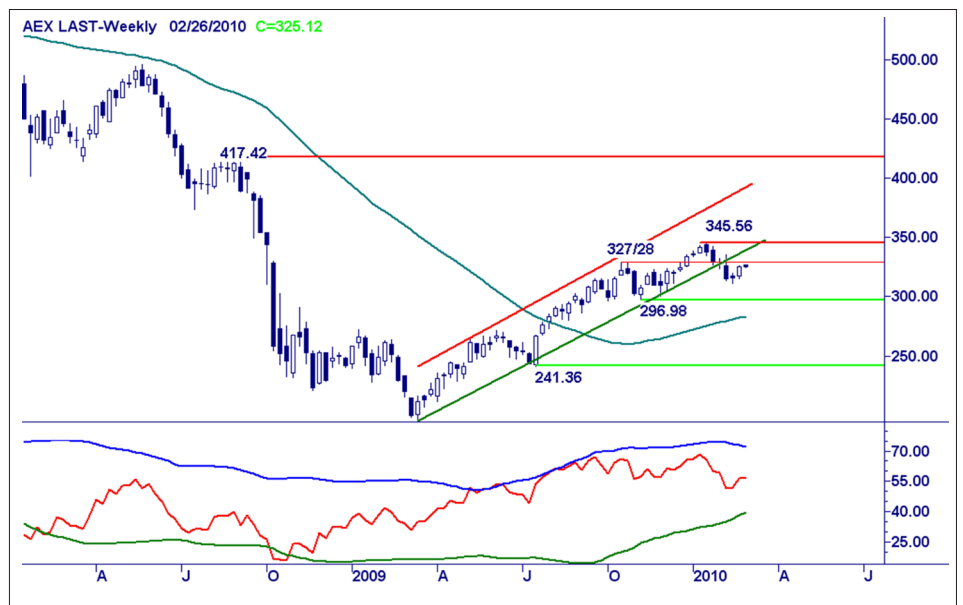
Weekgrafiek AEX Index. Bron: BTAC Visuele Analyse , 23 februari 2010

De koopconditie verval, de huidige overgangsfase vraagt om enige voorzichtigheid en afstand.