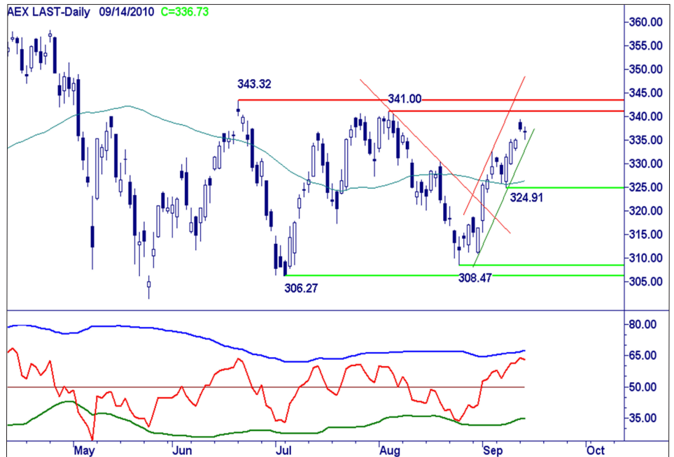
Daggrafiek AEX index.

De stieren hebben het moeilijk, maar houden de touwtjes in handen zolang de groene lijn als steunlijn fungeert. Een witte candle behelst een uitnodiging om aankopen te doen.