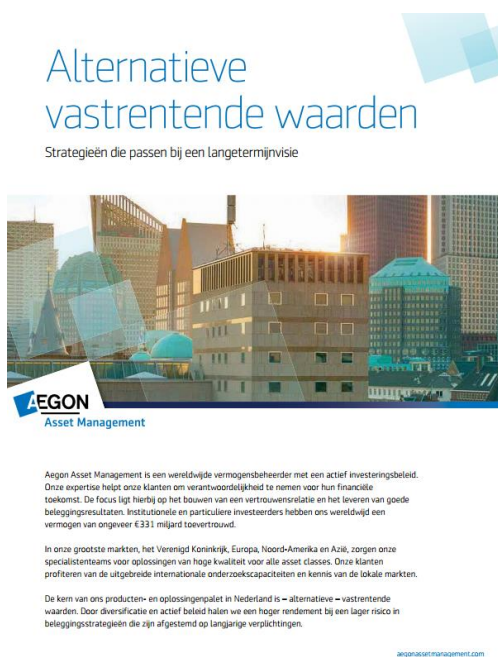
Full Colour Advertisement